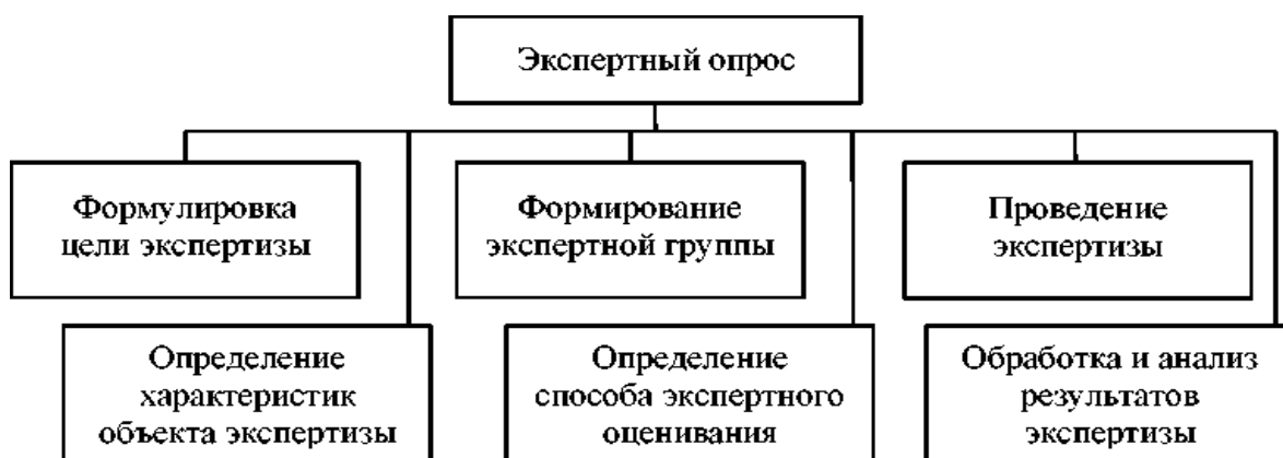
Рис. 1. Этапы экспертного опроса

стях (capabilities-based planning). Сценарное планирование предусматривает: выявление всех предпосылок; определение существенных уязвимых предпосылок, т.е. тех, нереализация которых потребует существенных изменений в планировании; создание указателей; проведение формирующих действий, направленных на контроль уязвимости существенных предпосылок; проведение защитных действий, позволяющих плану функционировать в случае провала одного из существенных допущений. Планирование, основанное на возможностях, в отличие от сценарного планирования, ориентированного на конкретную угрозу, делает акцент на себе. Можно выделить следующие ключевые моменты такого подхода: акцент на модулях (строительных блоках), которые могут быть использованы в разных ситуациях; монтаж возможностей; целевая ориентация на гибкость, адаптивность; множественные варианты измерения эффективности; открытая роль качественных оценок; экономика выбора (рис. 1) 1 .